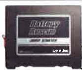
本体サイズ H190 H45 D160