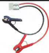
ブースターケーブル